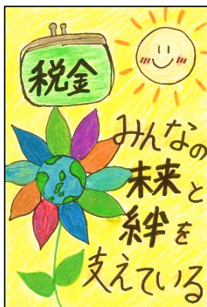
七ヶ浜町立松ヶ浜小学校 わか な み ゆ う 若 生 み ゆ う