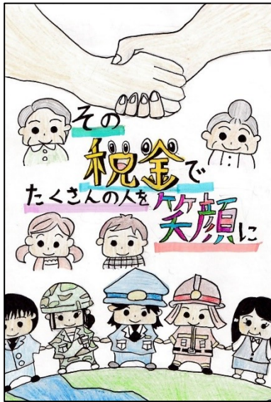
利府町立青山小学校 みや ぎ こ こ 宮 城 心 愛