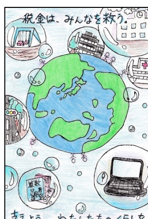
多賀城市立多賀城東小学校 ほし みず ずい 姫 星 瑞 姫